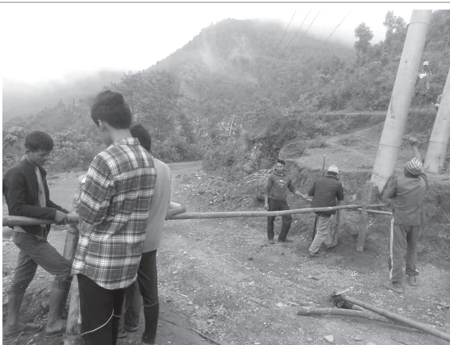
गाउँ प्रवेशमा रोक सरकारले लागू गरेको बन्दाबन्दीको समयमा आफ्नो गाउँ प्रवेश गर्ने नाकामा खटिएका दिक्तेल-रूपाकोट मञ्जुवागी नगरपालिका-१४ बुङ्गापाका युवा । हलेशी तुवाचुङ नगरपालिकाका एक युवकमा कोरोना भाइरसको संक्रमण देखिएपछि जिल्लाका दश बटै स्थानीय तहमा उच्च सतर्कता अपनाइएको छ ।